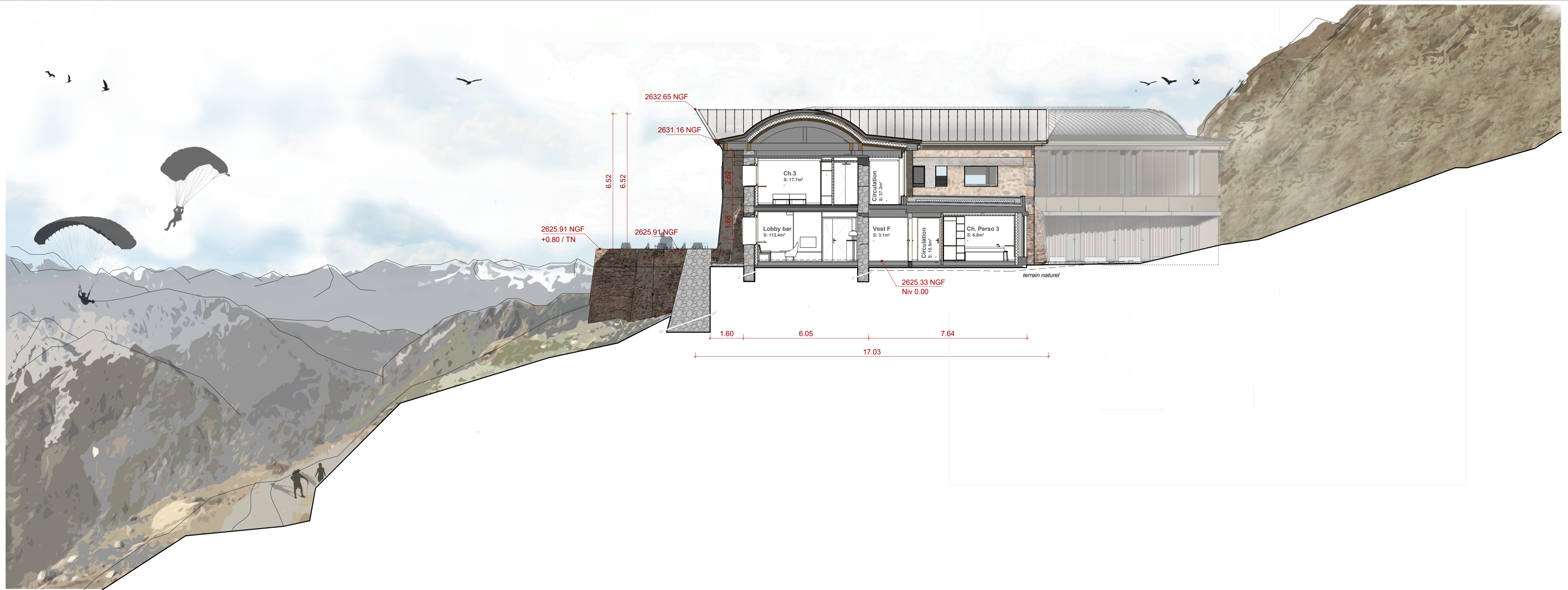
CT 01 - Coupe sur une chambre courante de l'existant • 1 : 100